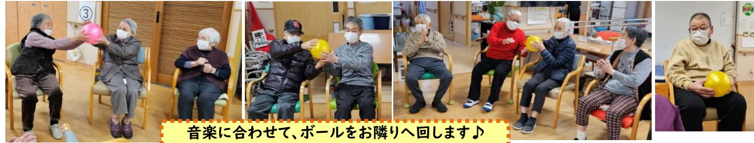
音楽に合わせて、ボールをお隣りへ回します♪