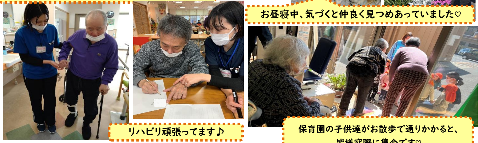
リハビリ頑張ってます♪