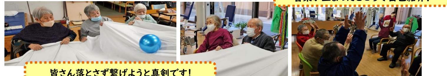
皆さん落とさず繋げようと真剣です!