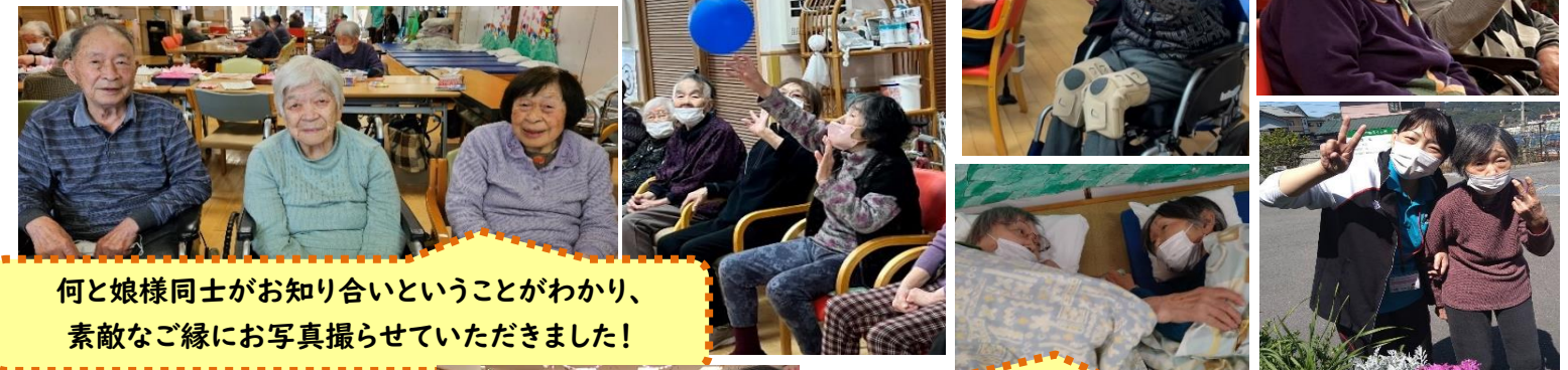
何と娘様同士がお知り合いということがわかり、素敵なお縁にお写真撮らせていただきました!