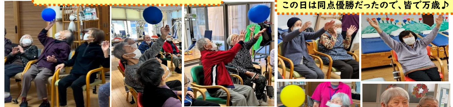
この日は同点優勝だったので、皆で万歳♪