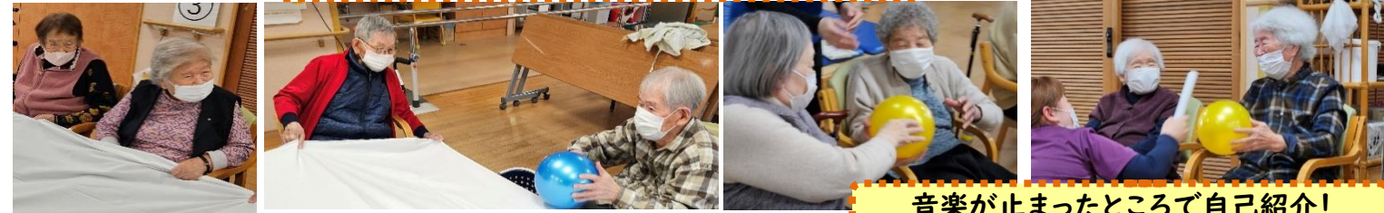
音楽が止まったところで自己紹介!