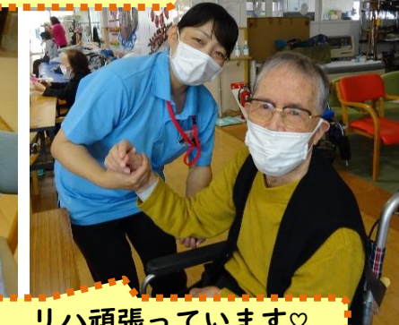
リハ頑張っています♡