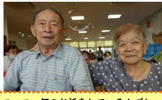
ニコニコ、何のお話をしているんでしょ