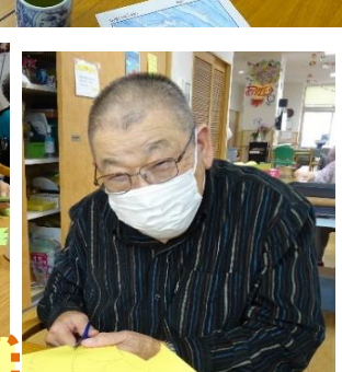
11月の壁画づくりです！これは・・・お猿さ