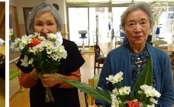
お花と私、どっちが綺麗♡?