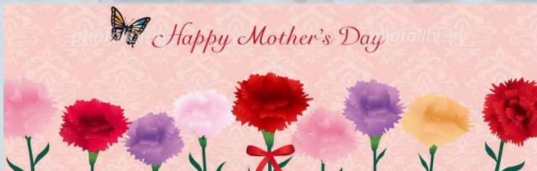
母の日をお祝いしてゲームで楽しみました♪苺大福もパクリ♡