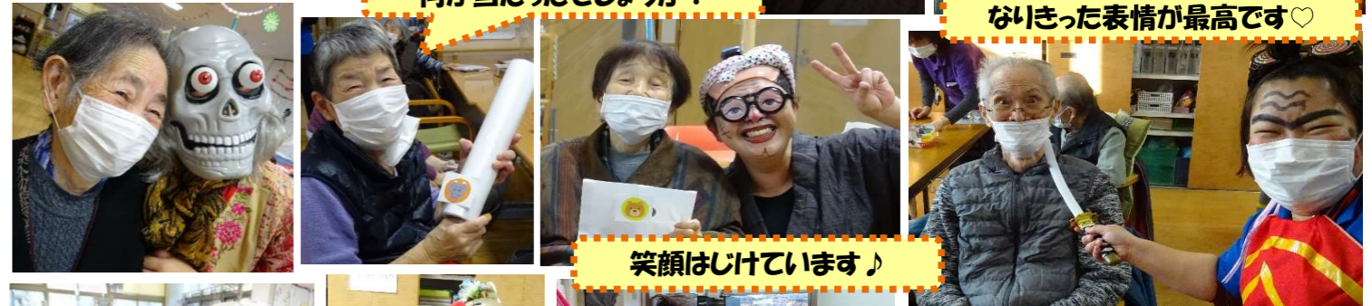
笑顔はじけています♪