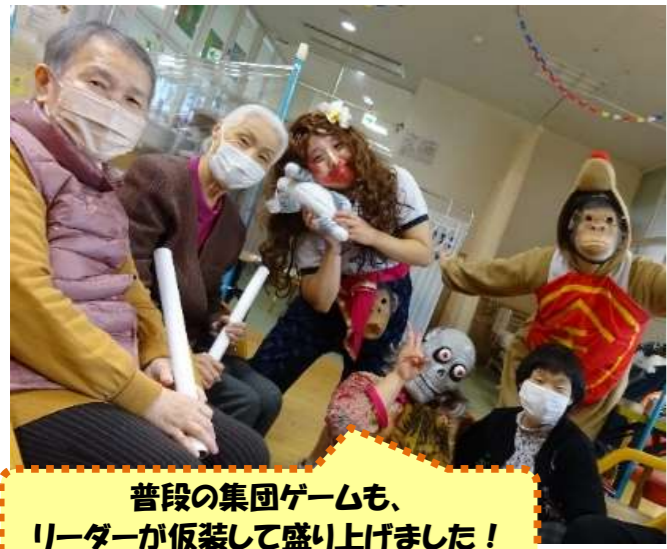
普段の集団ゲームも、リーダーが仮装して盛り上げました！