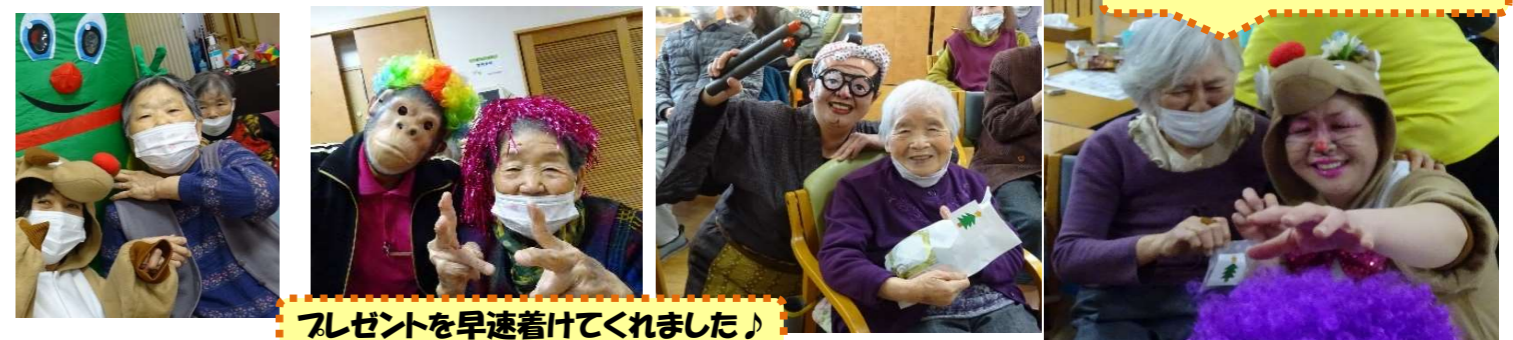
プレゼントを早速着けてくれました♪