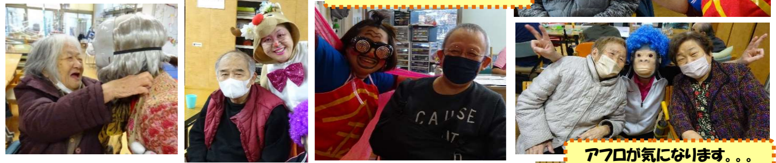
アフロが気に入ります。。