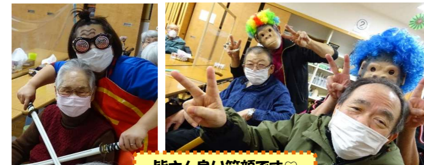
皆さん良い笑顔です♡