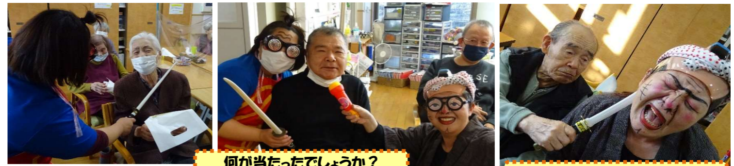
何が当たったでしょうか？

令和5年になりました。年末年始、ゆっくりと過ごされたでしょうか？ デイでは12月12日から一週間、忘年会を行いました！今年は、様々な種類のプレゼントを準備して、それをくじで引き当ててもらおうゲームがメインでしたが、それ以上にスタッフの仮装に皆さんが大笑いしてくださり、笑い声が響き渡る一週間となりました。新年にはなりましたが、今月号では忘年会でのたくさんの笑顔の写真をお届けします。今年も皆さんのデイで過ごす時間が笑顔あふれるかけがえのないものになりますように、スタッフ一丸となって盛り上げていきたいと思ひます！よろしくお願いたします。